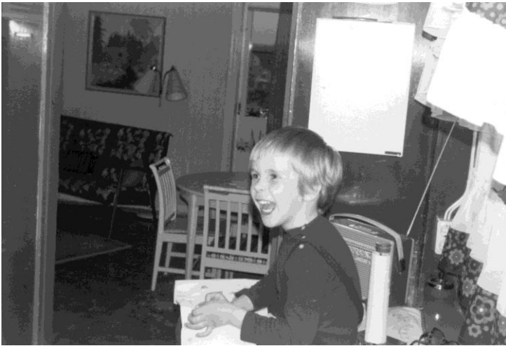
Jag i köket på torget.