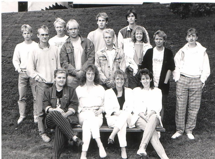
Min klass vid Gamleby folkhögskola. Jag står längst upp till höger.