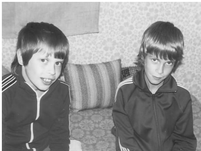
Peo och jag.