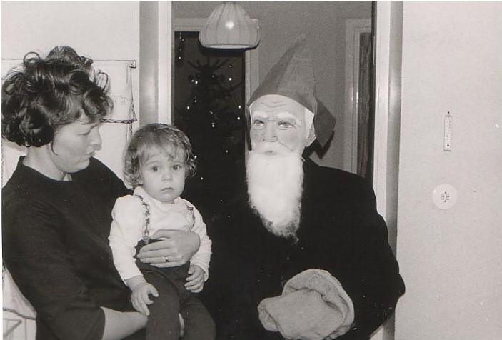
Mitt första möte med tomten.