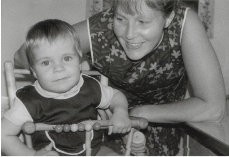
Min mor och jag.