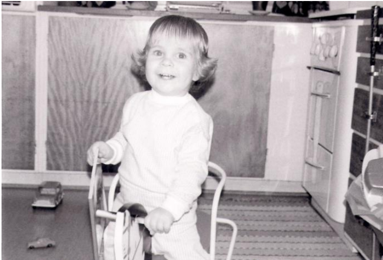
Jag på gunghästen.