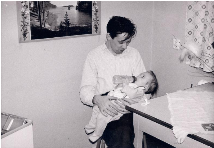
Min far ger mig välling.