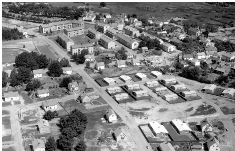
Flygfoto som visar mina barndomskvarter. I bildens övre del Pionjärområdet. I höger bildkant Kaninbacken vid torget.