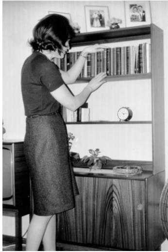
Min mor pysslar om bokhyllan.