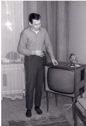
Min far framför den nya TV:n.