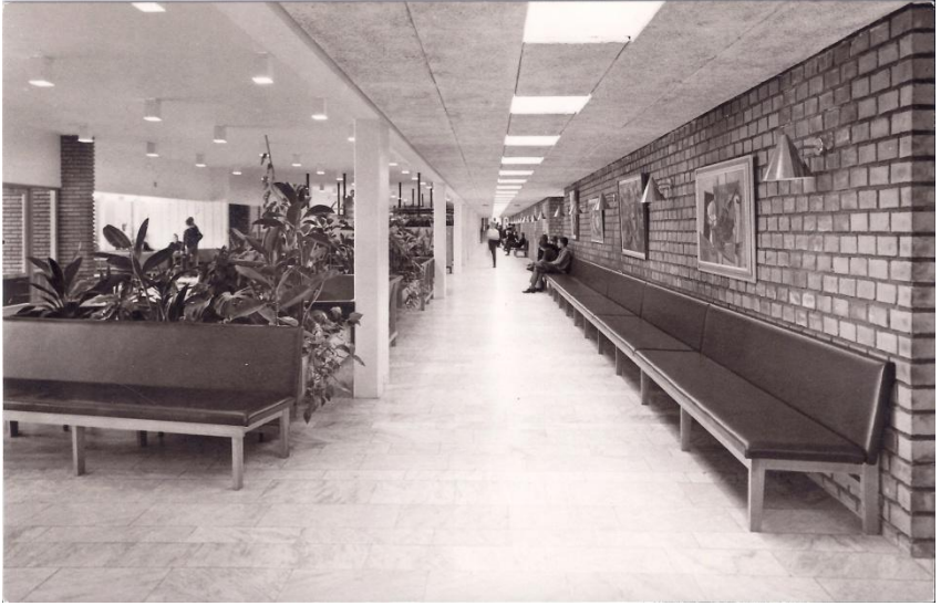
Parkskolans kapphall.