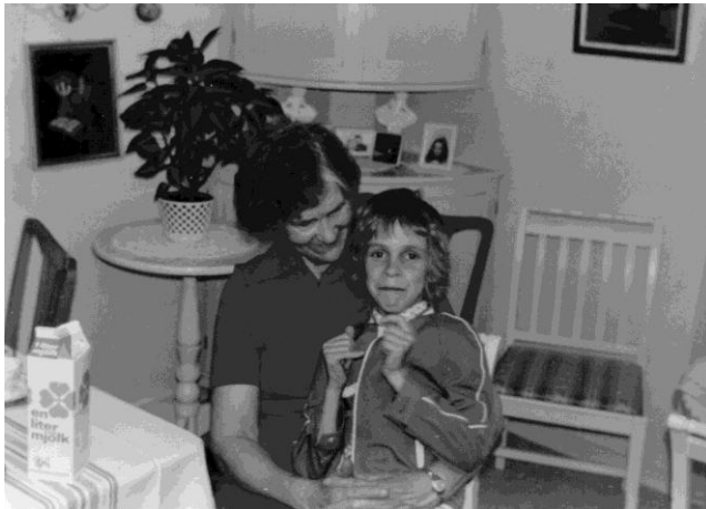
Mormor och jag.