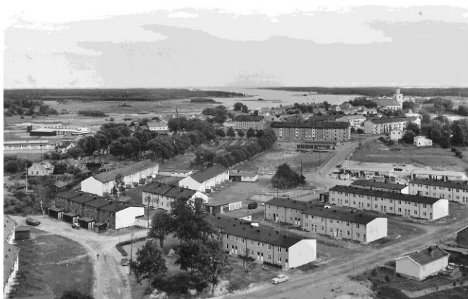
Vårt bostadskvarter sedan 2003 vid Kyrkogårdsgatan-Idrottsgatan. (Privat vykort)