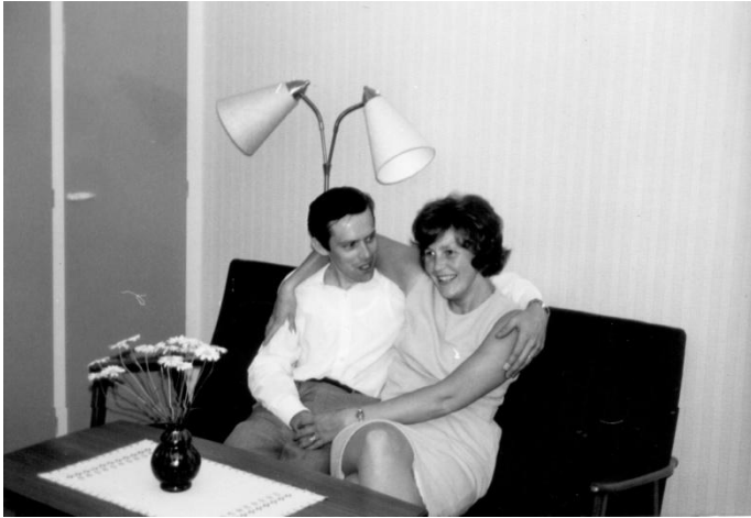
Far och mor på 1960-talet.