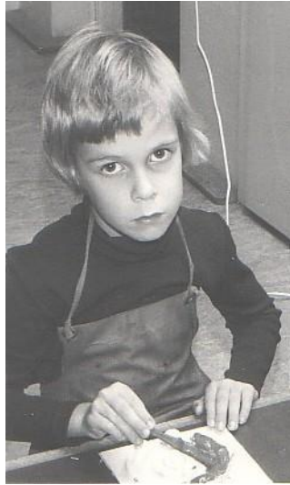
Jag var en blyg pojke.