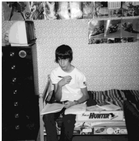
Jag i pojkrummet på Pionjärgatan.