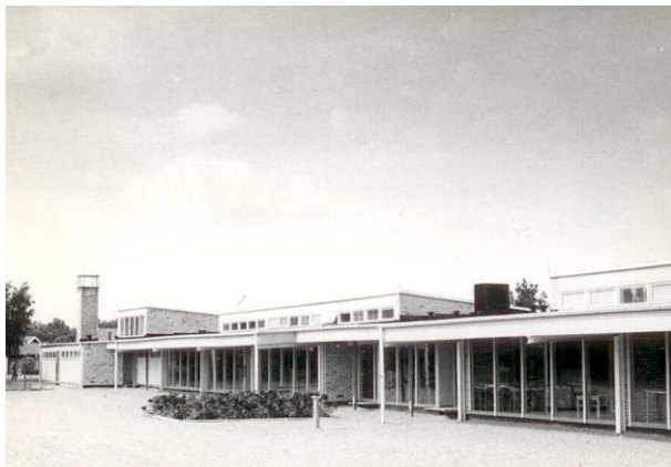
Mölstadskolan där jag gick årskurs 1-6.