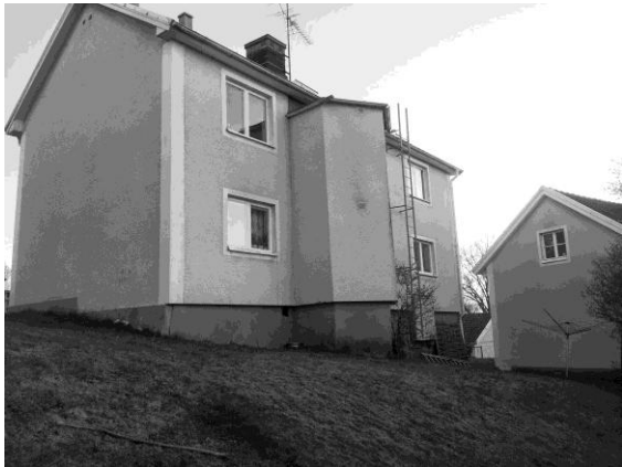
Huset på torget. Vår lägenhet låg på övervåningen.