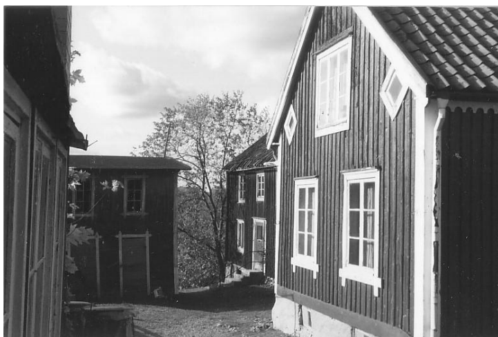
Det fanns många små bakgårdar och genvägar i Kaninbacken vid torget.