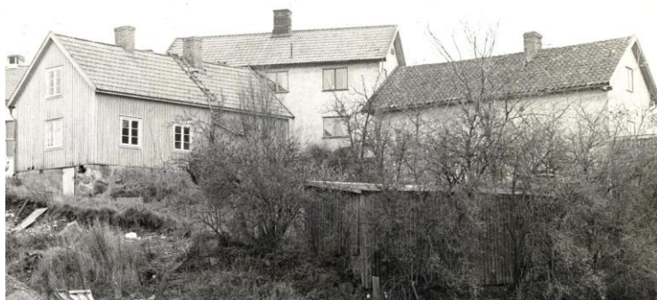
Del av Kaninbacken 1983. Vårt hus är det vita längst upp. I bild syns också en av de klassiska vildträdgårdarna.