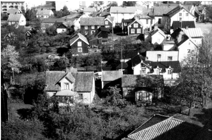
Kaninbacken väster om torget.