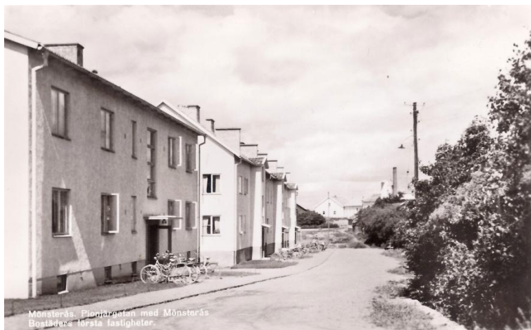
Pionjärgatan där jag bodde 1976-1987.