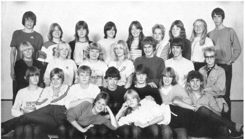
Klass 9A på Parkskolan. Jag står längst upp till höger.