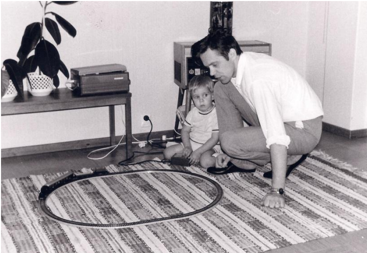
Pappa och jag leker med tågbanan.