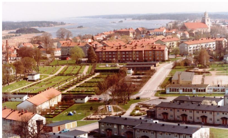
Här syns tre av de kvarter där jag bott. Närmast Mölstads radhus. Bortom kyrkogården ligger Pionjärområdet och där bakom skimtar Kaninbacken.