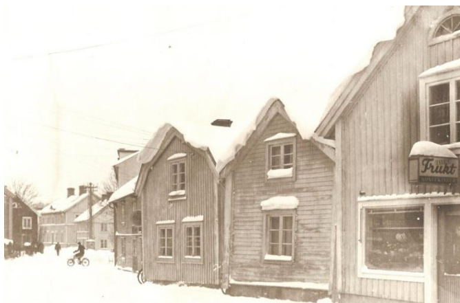
Storgatan i Mönsterås. De flesta hus i bild revs under 1960-talets rivningsvåg. I höger bildkant syns affären "Fruktan" som dock bevarades.