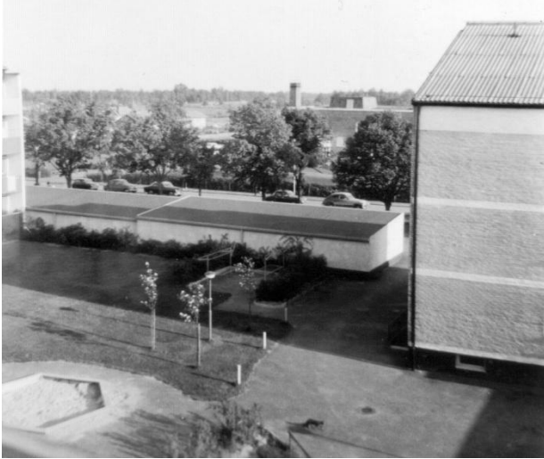
Innergården i Älgerum med den lilla lekplatsen där jag lekte som barn.