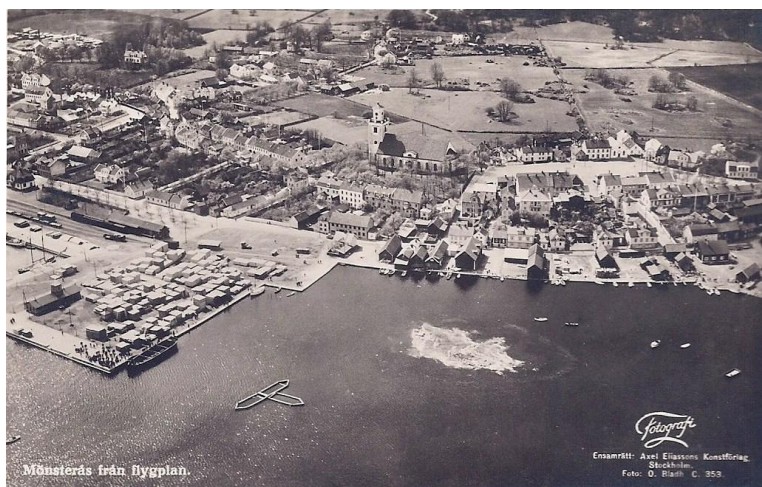
Mönsterås på 1940-talet innan den stora expansionen efter andra världskriget.