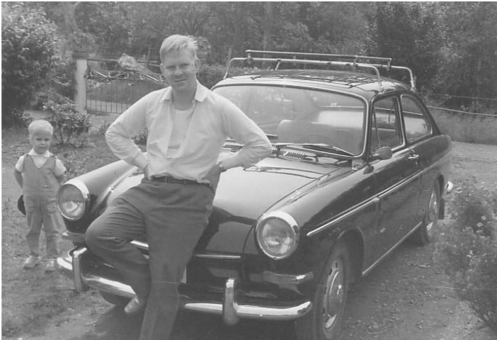
Morbror Beje och jag.