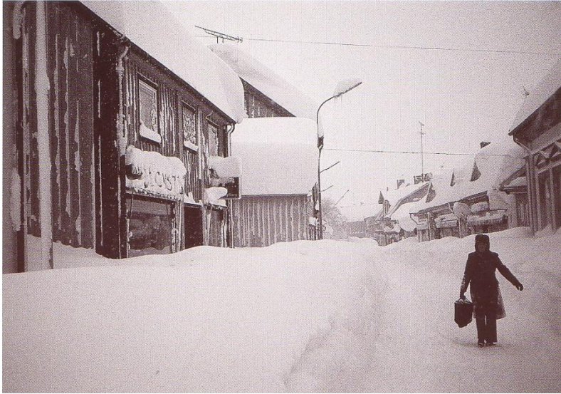
Storgatan, vintern 1979.