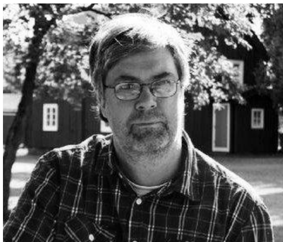
Jag i hembygdsparken.