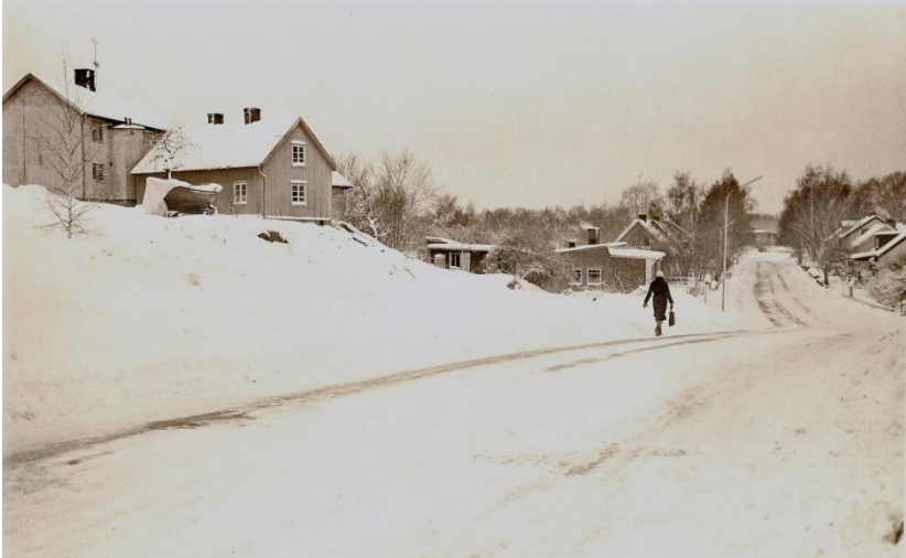
Torgbacken där vi åkte skidor och pulka. Vårt hus syns längst till vänster.