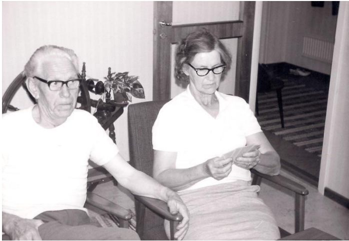
Morfar och mormor.