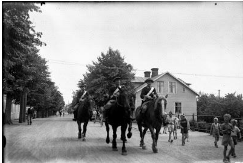
Husar Skog till vänster.